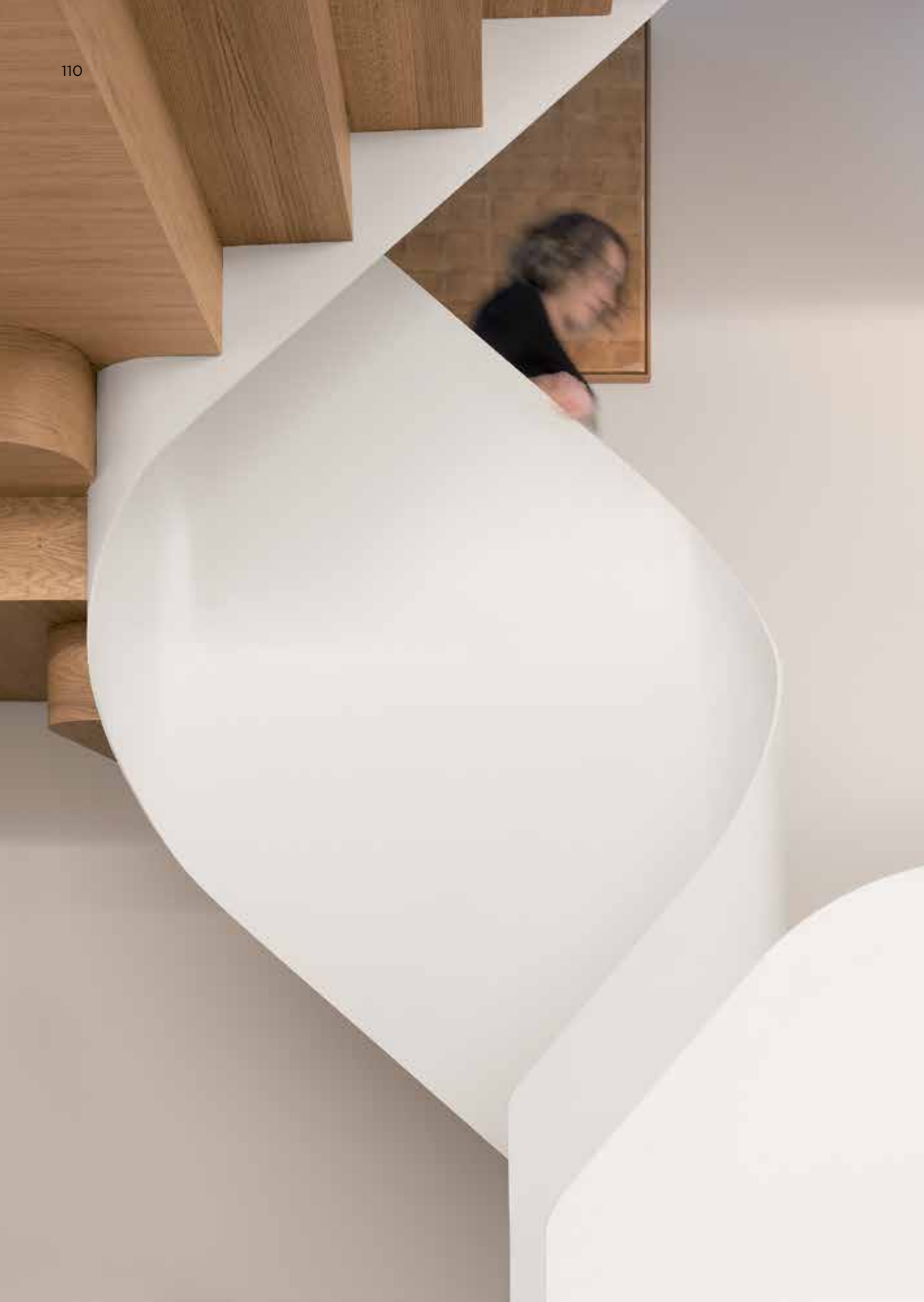
Вид на открытую лестницу на нижнем уровне первого этажа. Балюстрада изготовлена из цельной, окрашенной в белый цвет стальной пластины толщиной 8 мм. Справа: Мансардное окно в верхней части лестницы пропускает дневной свет через открытую лестничную клетку в центр здания. View of the open staircase at the lower ground floor. The balustrade is made with a continuous white-painted 8 mm steel plate. Right: The skylight at the top of the staircase brings daylight through the open stair-well at the core of the building.