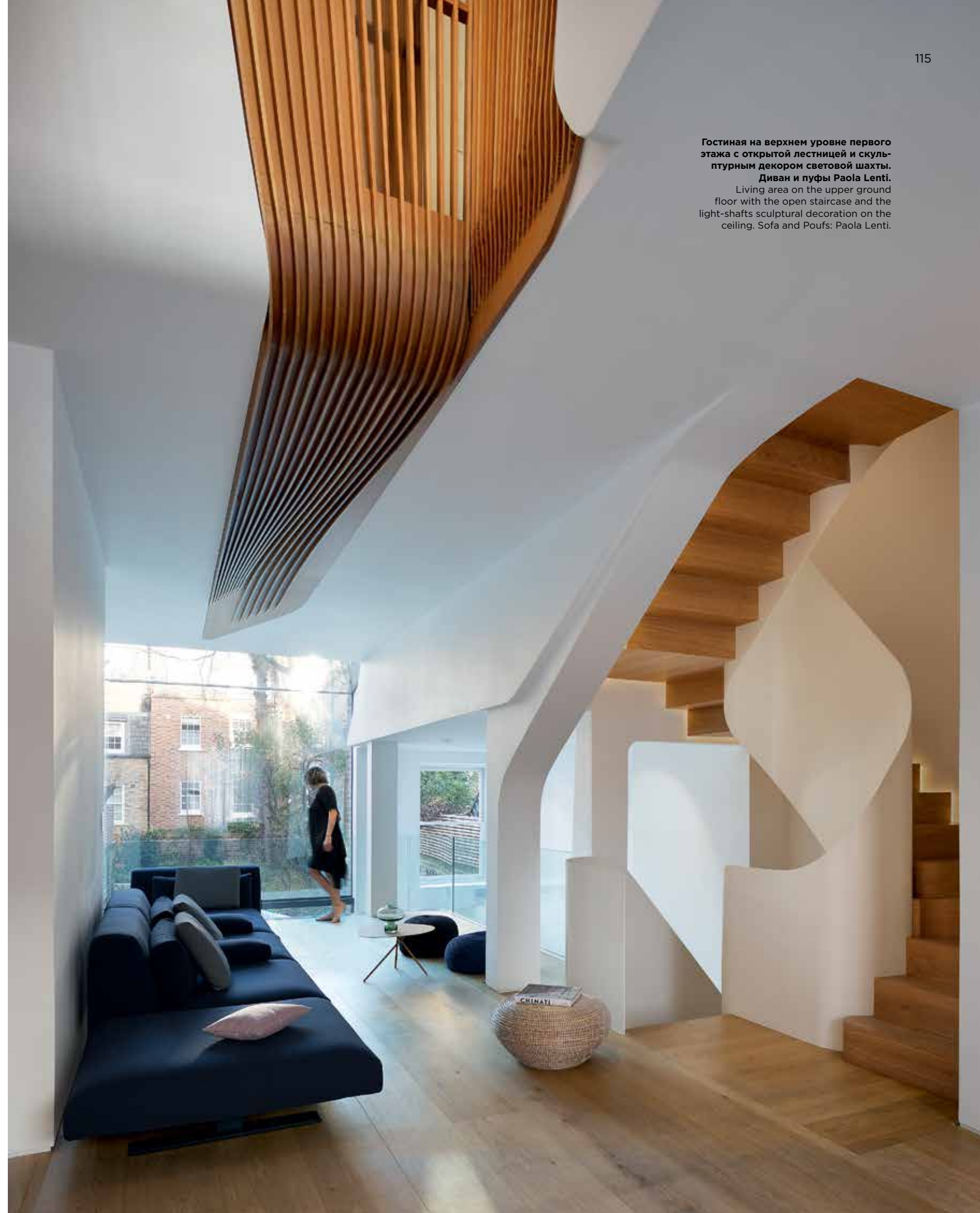
Гостиная на верхнем уровне первого этажа с открытой лестницей и скульптурным декором световой шахты. Диван и пуфы Paola Lenti. Living area on the upper ground floor with the open staircase and the light-shafts sculptural decoration on the ceiling. Sofa and Poufs: Paola Lenti.